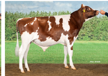
Delta Primetime PP