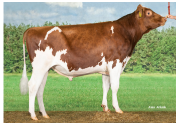
Delta Vision PP