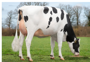
Delta Endless - dtr.