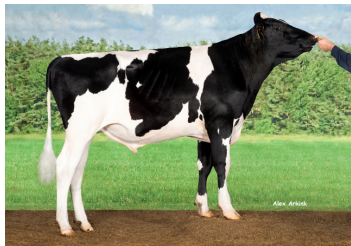
Delta Artemis PP RF