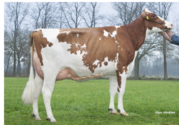
Hul-Stein Red Style - mm. til Delta Marsrover PP