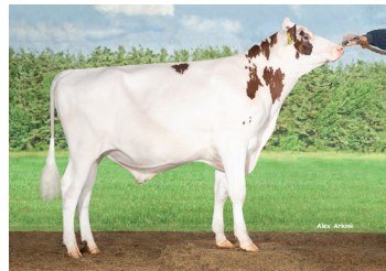
Delta Holger PP