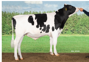
Delta Volkmar PP