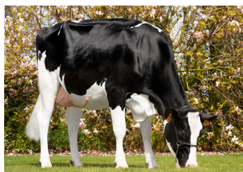
Willem's Hoeve Woody - dtr.