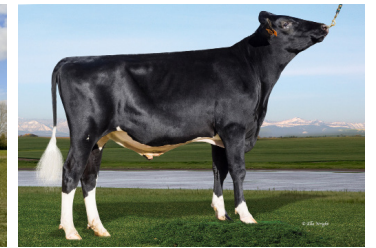
Terra Calroy Zuri

RABAT-ordning (gælder samlet antal doser konventionel, SiryX og kødkvæg): >40ds -5%, >80ds -10%, >120ds -15%