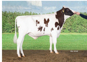
Delta Drone PP