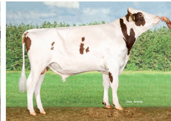
Delta Kingdom P