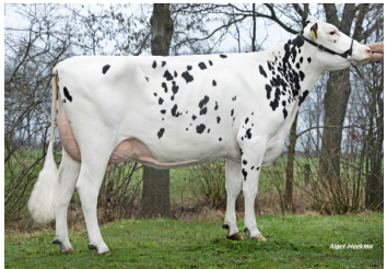
Poppe Freestyle - dtr.