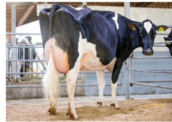
Siemers Lambda Paris (mor til Siemers Orono)